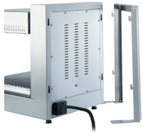
Wall mounted support optional